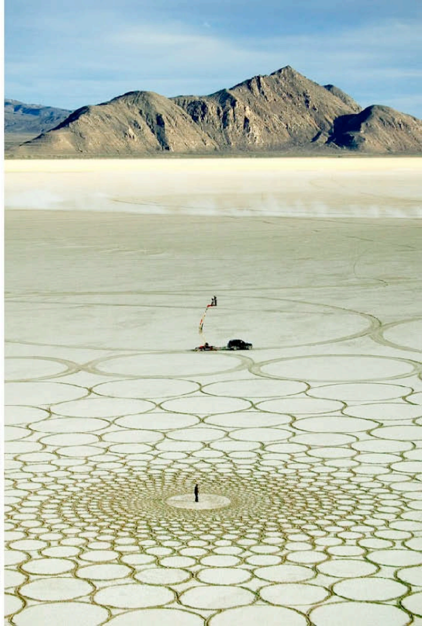
Благодарим за помощь в подготовке фотографа Мити Молчанов (Евгений Курейко)